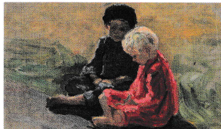
Copii jucându-se, Nikolai Bogdanov Belski

Lucrați în perechi! Povestește-i colegului/colegei de bancă ultima ceartă dintre tine și părinții tăi. În discuție, vei menționa: locul și timpul conflictului, participanții, motivul de la care a pornit cearta, sentimentele trăite de tine, sentimentele pe care crezi că le-au simțit părinții tăi.