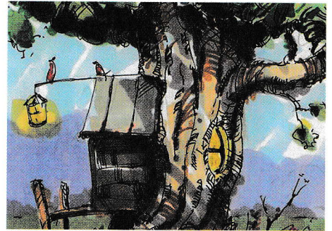
Căsuță în copac