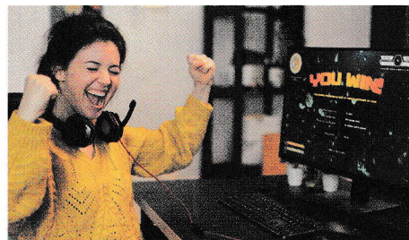
Jucătoare de jocuri pe calculator, bucuroasă de victorie