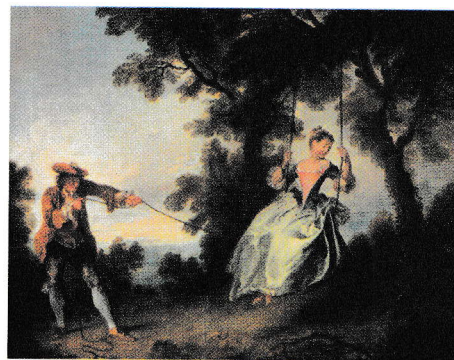
Leagănul, Nicolas Lancret